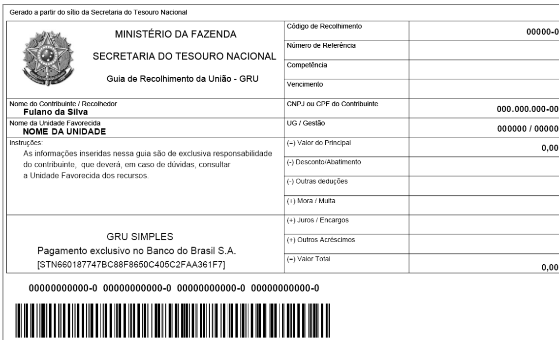
Modelo de boleto de GRU Simples